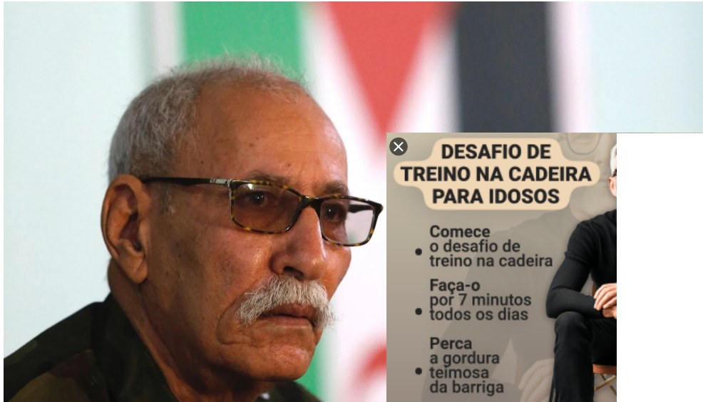
El líder del Frente Polisario y presidente de la República Árabe Saharaui Democrática (RASD), Brahim Ghali.

En una reunión interna, señaló a Francia como su principal enemigo en la ONU