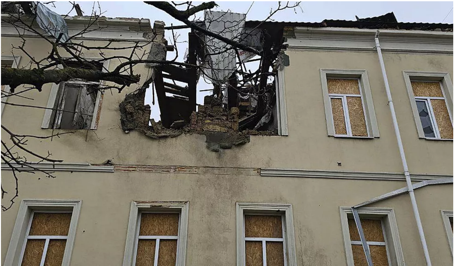
قتيلان وجريح في قصف روسي على جنوب أوكرانيا (2023/12/21/russia-bombing-ukraine-2-death-wounded-war-conflict-kyiv-moscow)