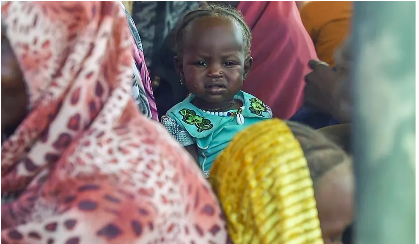
عدد النازحين جراء الحرب في السودان تخطى سبعة ملايين شخص (number-people-displaced-result-war-sudan-exceeded-seven-/2023/12/21/) (million)