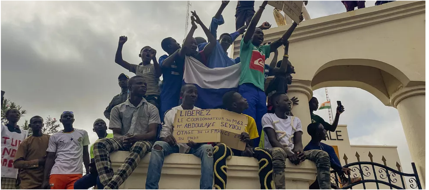
فرنسا تغلق سفارتها في النيجر (france-closes-its-embassy-niger-diplomatic-sources-politic/2023/12/21/)