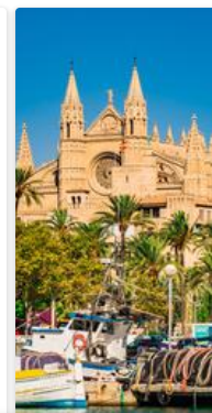
Porto - Funchal Maiorca