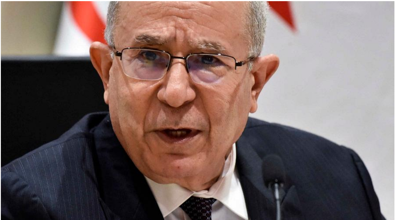
Ramtane Lamamra.