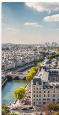
Porto - Paris