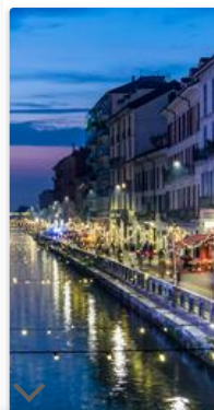
Porto - Milão

Sur le statut d'observateur accordé à Israël à l'Union africaine, Ramtane Lamamra a expliqué que «nous n'avons pas pris l'initiative d'accorder un quelconque statut d'observateur à quiconque». «Il y a une double faute, a-t-il dit, celle d'avoir accordé le statut d'observateur sans aucune consultation avec les Etats membres, dont l'Algérie. Si la décision a pour effet inévitable de diviser l'organisation sur laquelle vous avez le devoir de veiller, cela signifie que la décision est mauvaise et qu'il ne faut pas la prendre. En l'occurrence, si les consultations préalables avaient eu lieu, sans doute n'aurait-on pas pris une telle décision. La seconde faute, c'est d'avoir constaté que les Etats membres sont divisés sur cette question et de la laisser se gangréner, ce qui est très mauvais pour l'organisation. Donc, indépendamment de qui a fait quoi au profit de qui ou de quoi, le fait est que la décision en question est une décision qui met en péril la solidarité qui doit exister entre les pays membres de l'organisation», a argumenté le chef de la diplomatie dans un entretien aux médias officiels français France 24 et RFI.