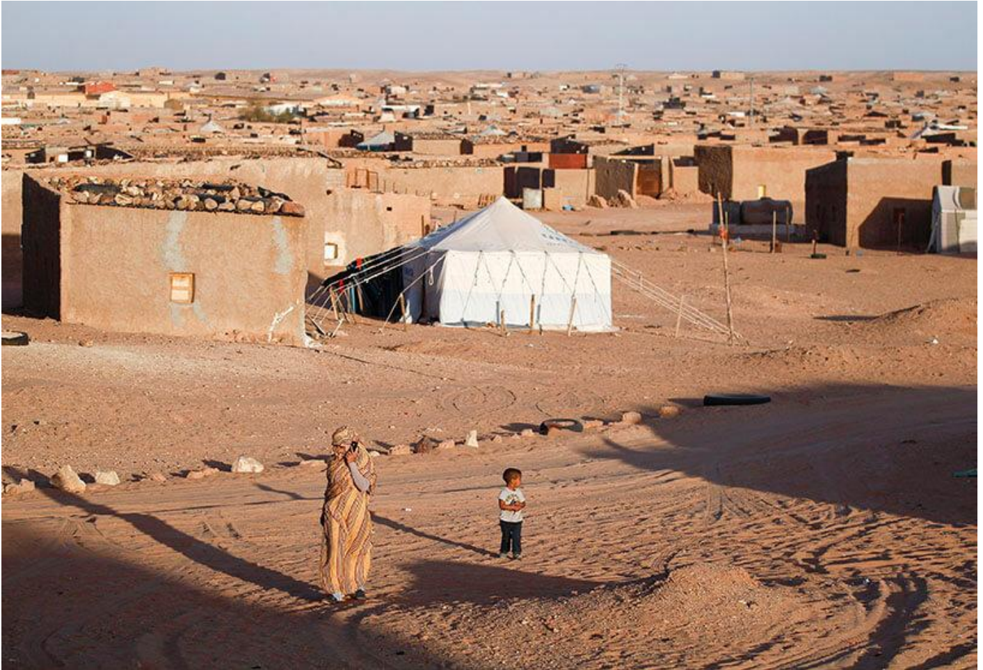
Campamento de refugiados de Boudjdour en Tinduf, en el sur de Argelia

Tras evaluar la primera gira del enviado de la ONU Staffan de Mistura Atalayar