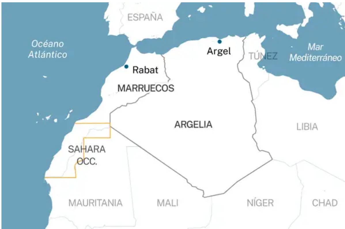
Magreb

Fuentes del diario marroquí “ Le Desk ” aseguran que el enviado especial –que fue confirmado en el puesto el pasado mes de octubre- se reunirá hoy en la capital de Marruecos con el ministro de Exteriores marroquí Nasser Bourita sin que haya prevista una rueda de prensa tras el encuentro. El jefe de la diplomacia marroquí, que sigue sin recibir al titular de Exteriores español José Manuel Albares , mantiene una intensa agenda diplomática en los últimos meses.