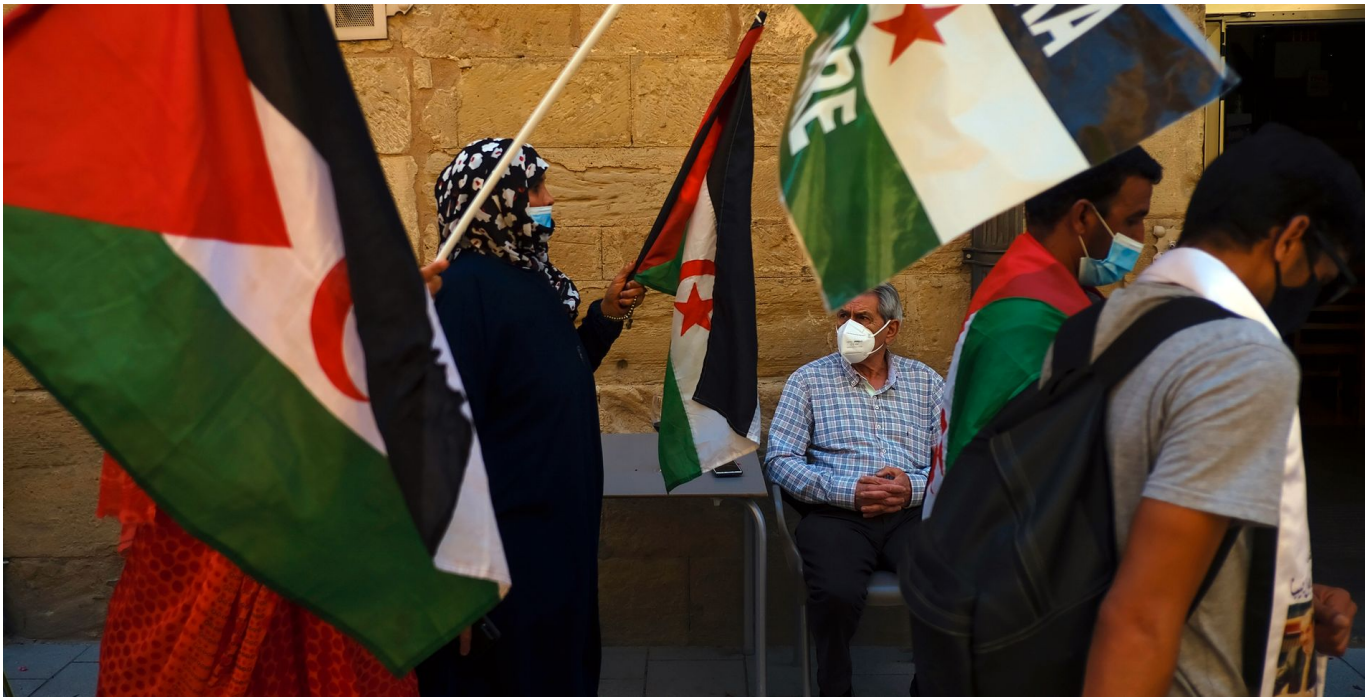
Bildet er fra en protest mot okkupasjonen i Spania tidligere i år.