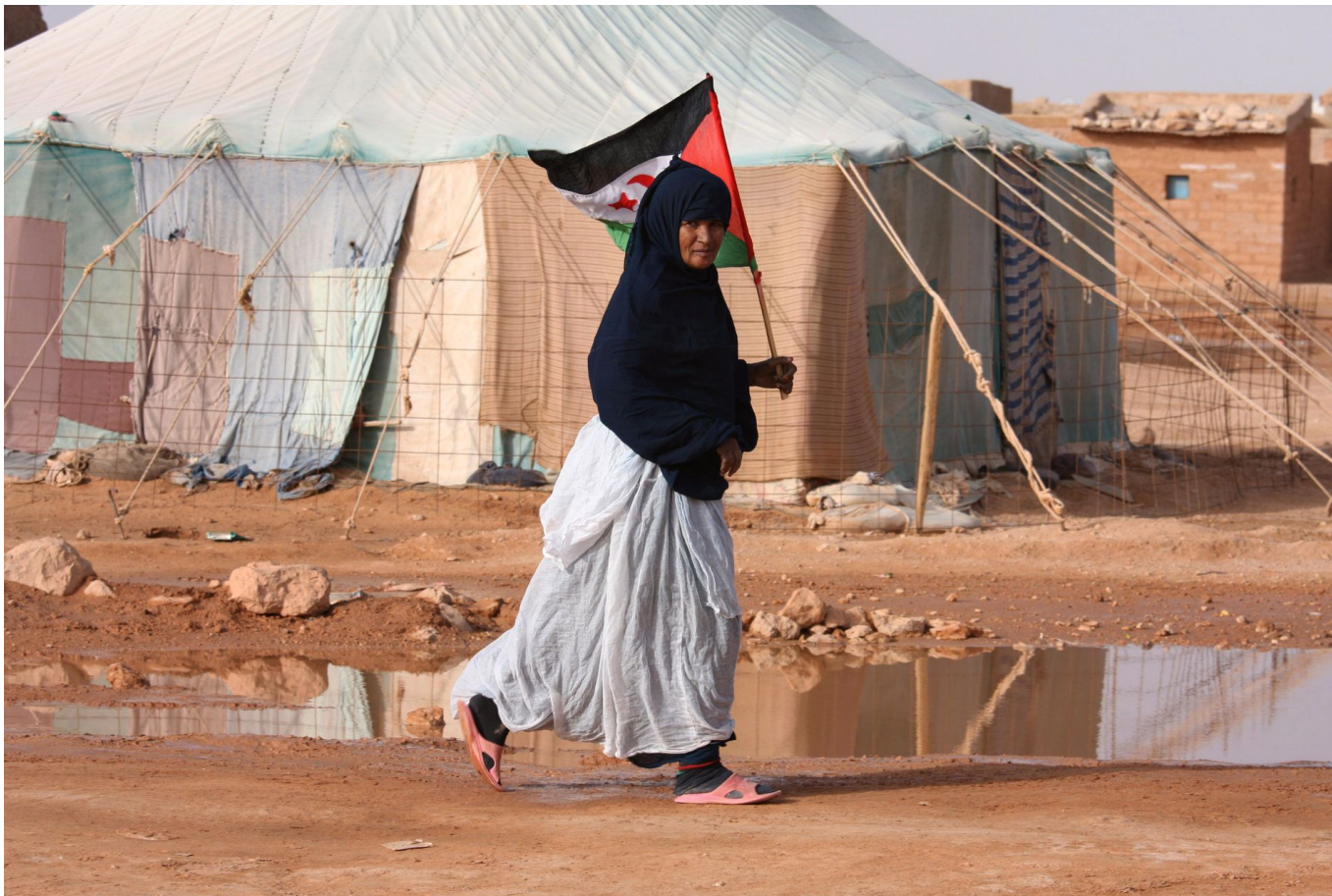
Flertallet av den opprinnelige Vest-Sahara-befolkningen, saharawiene, lever som flyktninger i Algerie.

– Det er et paradoks at Norge investerer så tungt i selskaper som undergraver FNs prosess samtidig som vi sitter rundt Sikkerhetsrådets bord.