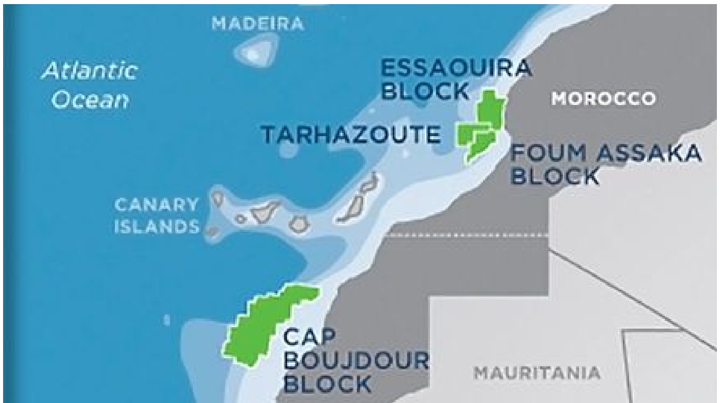
Infografía del proyecto de perforaciones de la compañía Kosmos Energy en aguas de Marruecos y del Sahara Occidental.

En un informe de octubre de 2014, previo a las exploraciones de Kosmos, la organización Western Sahara Resource Watch (WSRW), que opera desde Bruselas, recordaba que "cuando el Gobierno español adjudicó a Repsol la concesión para perforar en esas aguas, la indignación fue general. Pero, unos kilómetros más allá, la perforación que está prevista comenzar en diciembre será mucho más controvertida en algunos aspectos", porque "no está claro quién sería legalmente responsable si la exploración perjudicara a la vida marina o a las existencias de pescado". Además, WSRW aseguraba que suponía "una violación del derecho internacional (...) ya que abre la puerta a un afianzamiento de las infundadas pretensiones de Marruecos de soberanía sobre el territorio, y ningunea el deseo de la población nativa saharauí".