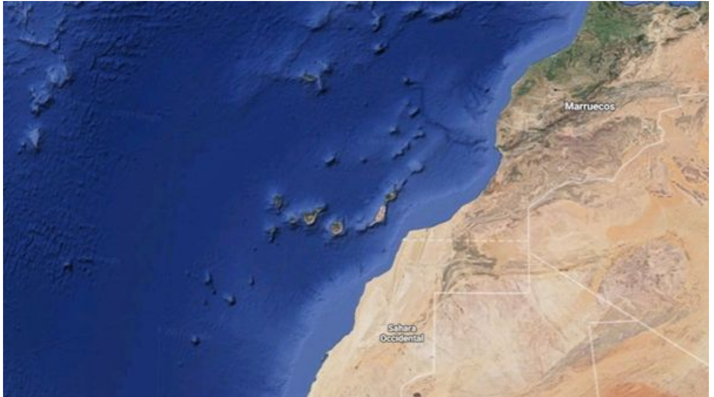
Aguas del Sáhara Occidental, Marruecos y Canarias. Google Earth.

– Canarias "reaccionará de forma inmediata" si las prospecciones autorizadas por Marruecos afectan a aguas isleñas