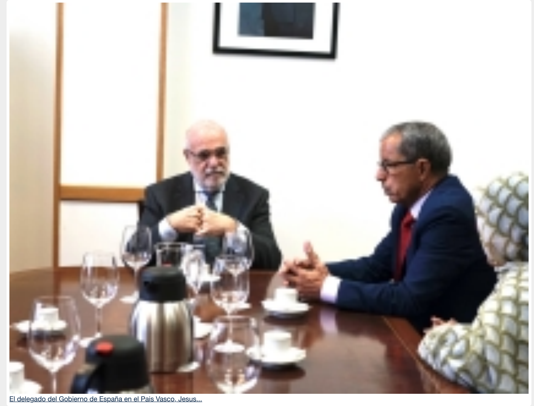
El delegado del Gobierno de España en el País Vasco, Jesús...