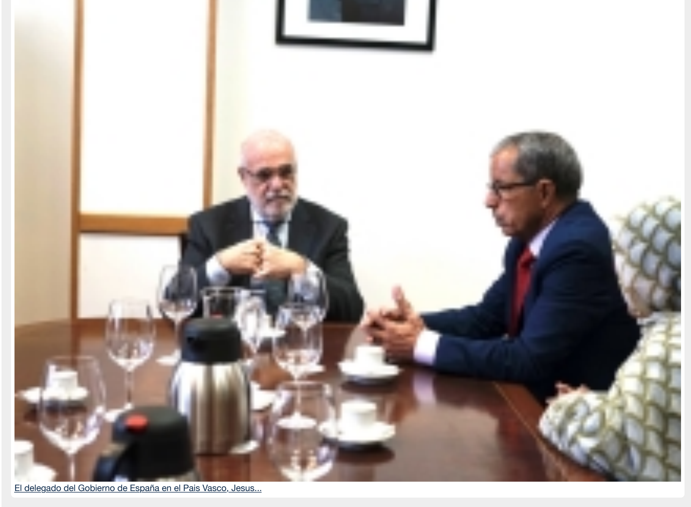
El delegado del Gobierno de España en el País Vasco, Jesus...