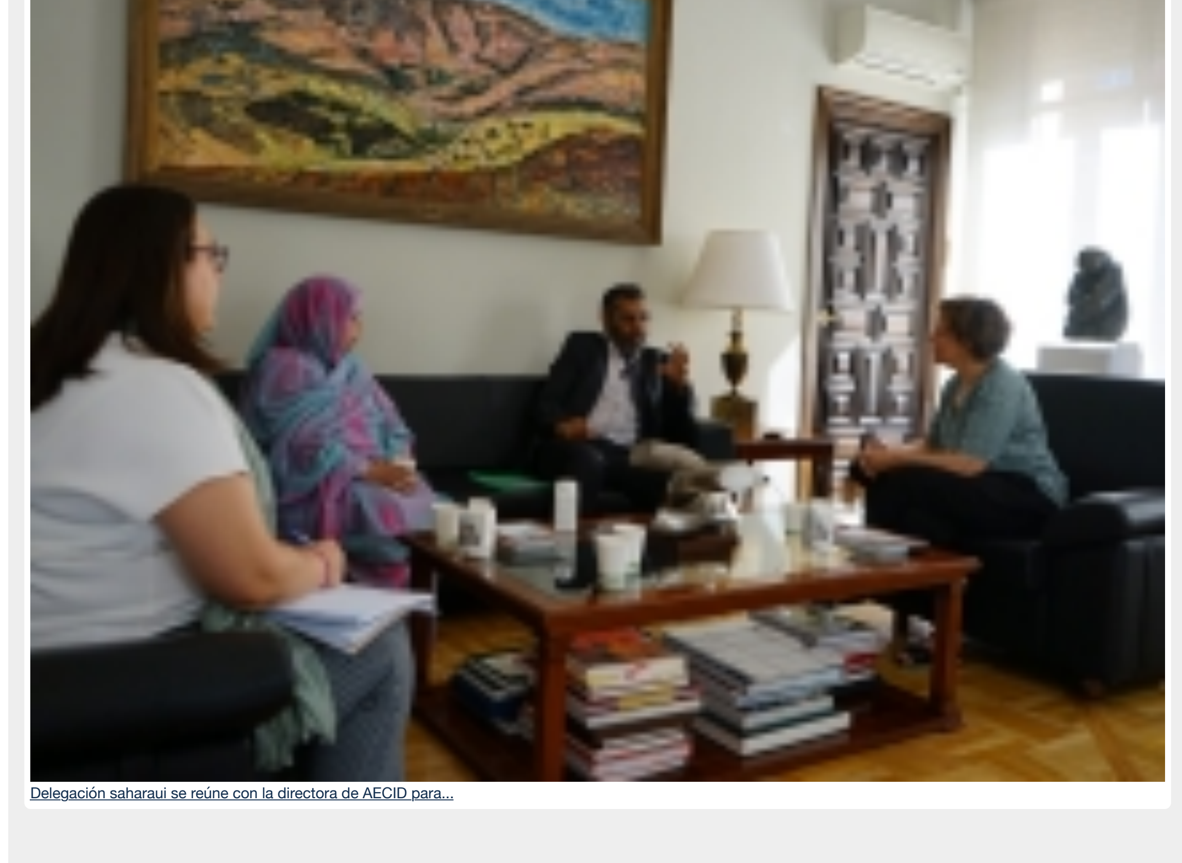
Delegación saharai se reúne con la directora de AECID para...