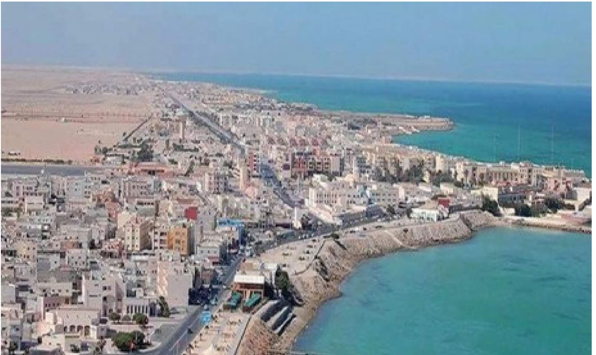
Conférence sur «La résistance dans la région de Dakhla-Oued Eddahab et la marche de l'indépendance et de l'unité»