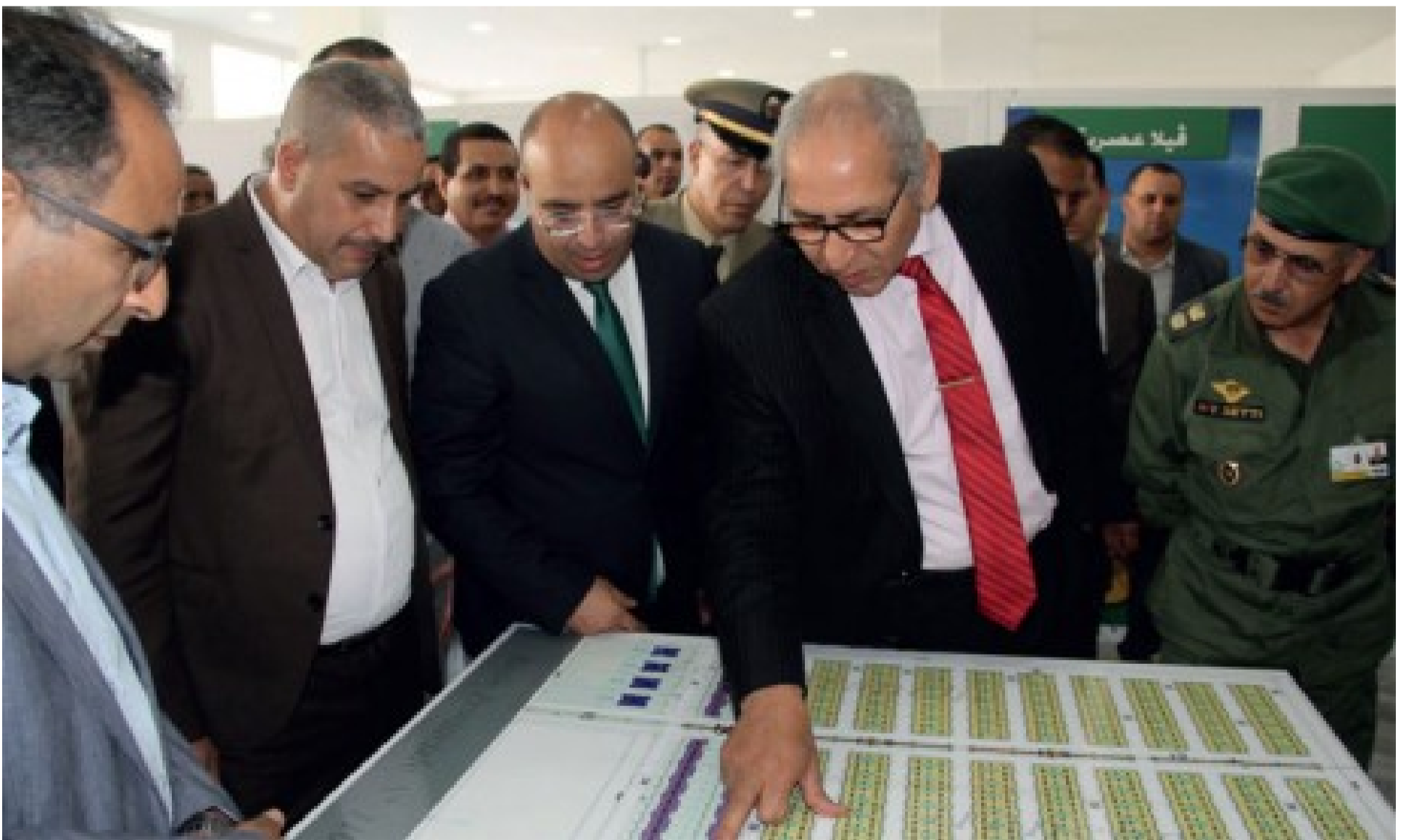
Le Groupe «Aakar Orient» compte investir 400 millions de DH dans des projets immobiliers