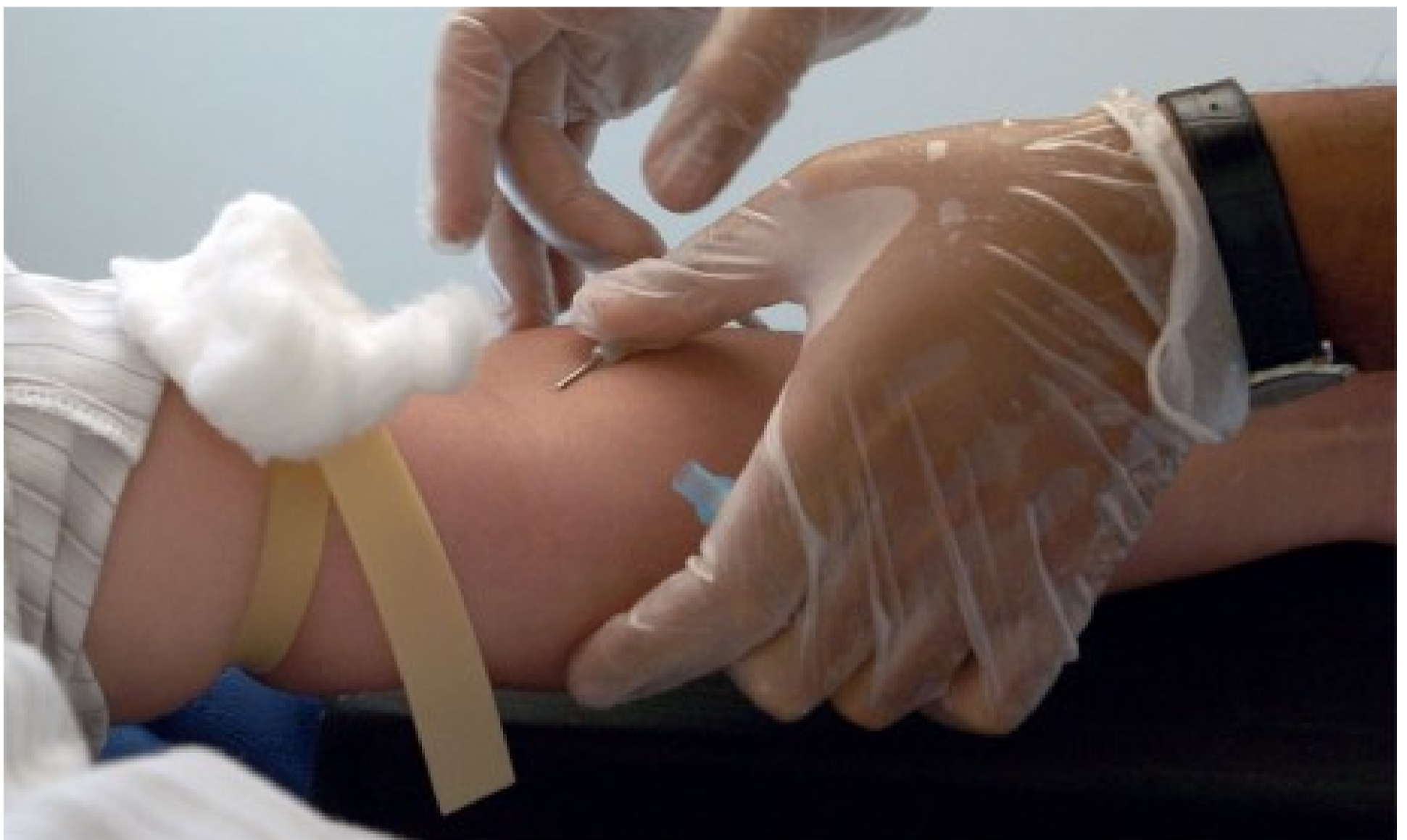
Campagne de collecte de sang : La société civile répond à l'appel