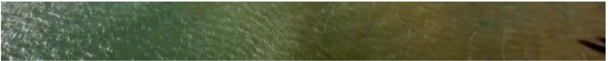
Dakhla hisse le «Pavillon Bleu» sur Oum Labouir