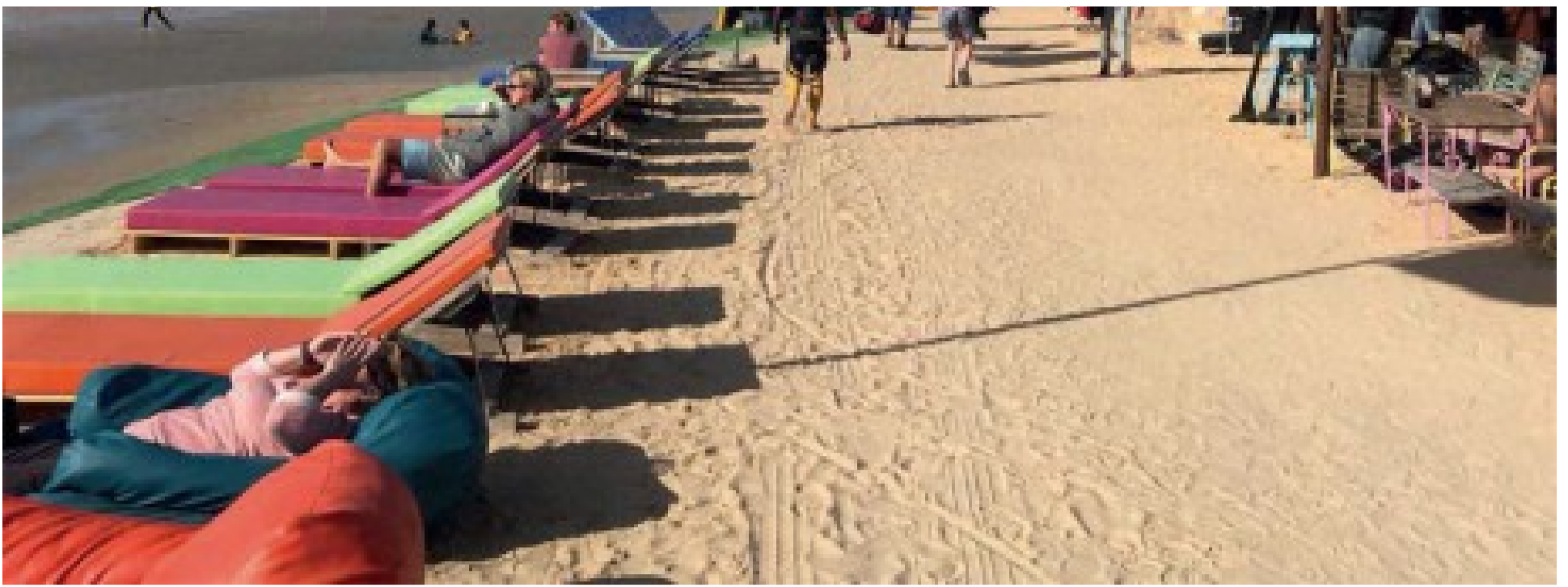
Anapec : 134 personnes sensibilisées à l'auto-emploi et 128 projets créés en 2019