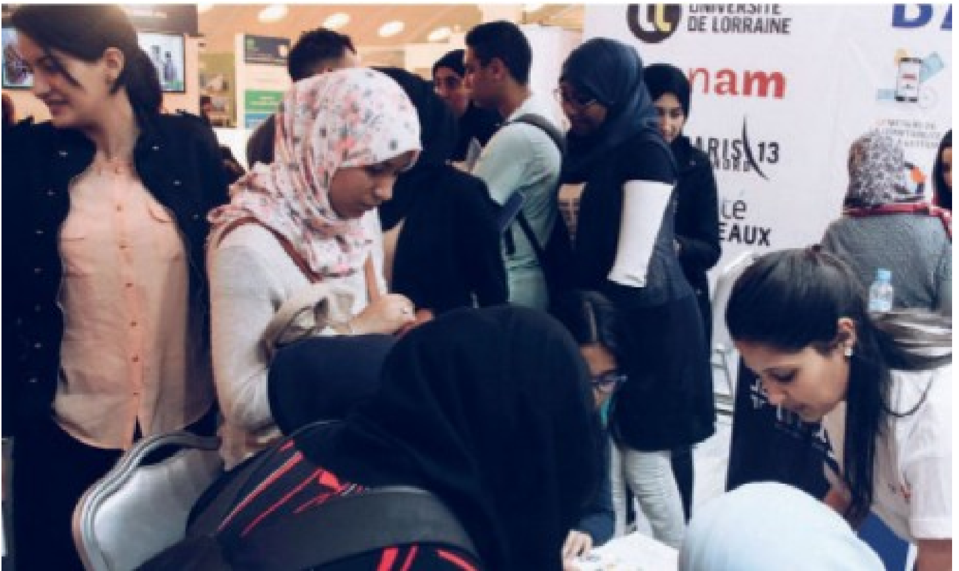
Signature d'une convention pour la promotion de l'orientation scolaire et universitaire