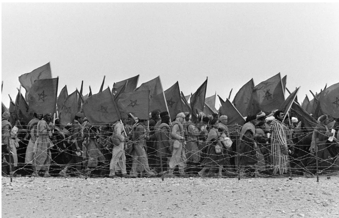
Le 7 novembre 1975, à l'appel de leur roi, près de 350 000 Marocains marchent sur le Sahara occidental, avant même le départ des colons espagnols.

Devant ce coup de force, les indépendantistes sahraouis lancent leur lutte, fondent le Front Polisario (Frente Popular de Liberación de Saguía el Hamra y Río de Oro) et proclament, en 1976, depuis leur exil à Tindouf en Algérie, la RASD, la République arabe sahraouie et démocratique, un État que la grande majorité de la communauté internationale ne reconnaîtra (l'ONU, en revanche, se déclare pour l'organisation d'un référendum d'auto-détermination du Sahara occidental).